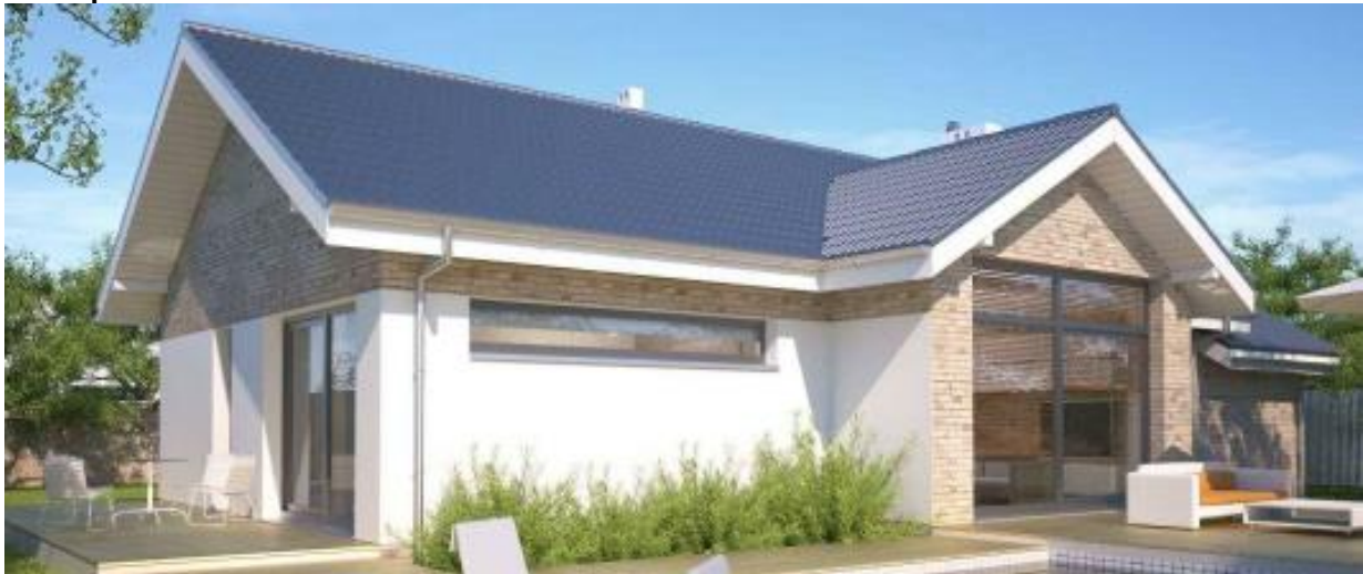
Foto Perspektive 2