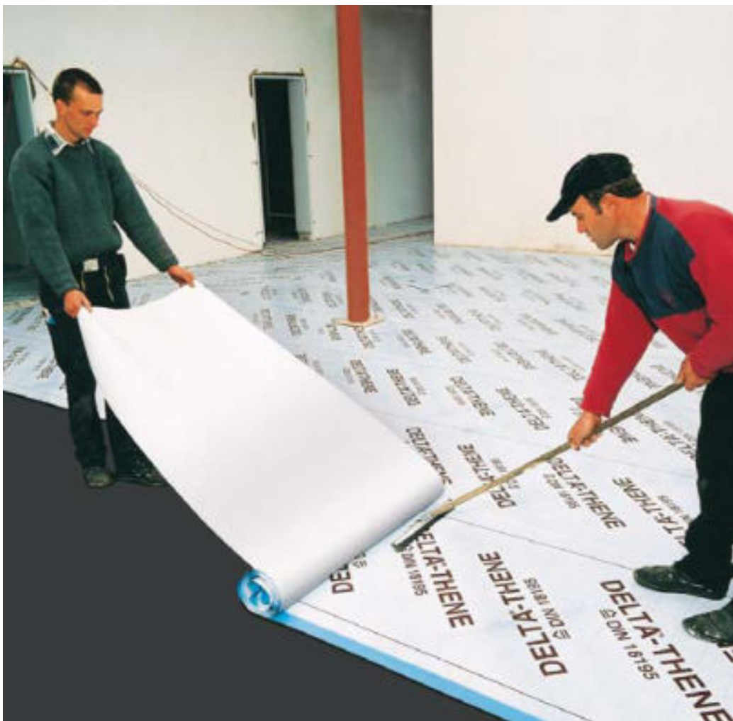
Große Flächen können mit DELTA®-THENE ganz einfach und ohne Unebenheiten abgedichtet werden.