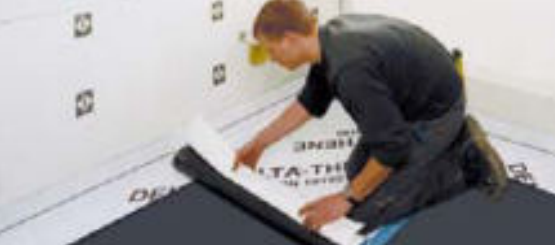
Schnelle Verarbeitung von der Rolle.