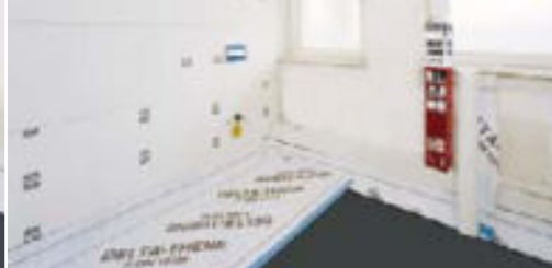
Sichere Abdichtung in Nassräumen.