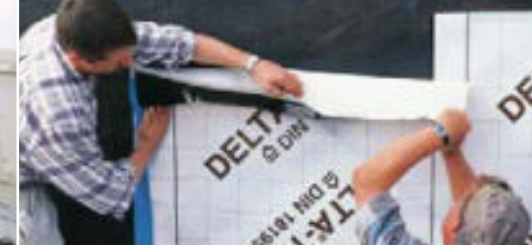
Zuverlässiger Schutz von Kellerwänden.